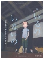
「いるのいないの」 京極夏彦(著) 岩崎書店