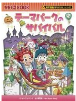
「テーマパークのサバイバル」 ポドアルチング(著) 朝日新聞出版