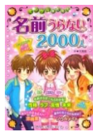
「ミラクルあたる！ 名前うらない2000」 天馬 梨(著) 西東社