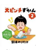
「大ピンちずかん2」 鈴木 のりたけ(著) 小学館