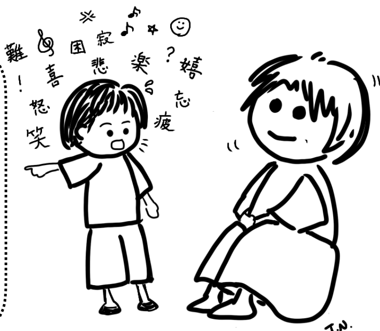
※これは相談のイメージです。

子どもたちの普段の様子や何気ない行 動や言葉を大切にしながら、相談にいら した方と一緒に話し合い、考えていきた いと思います。